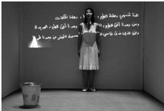
→ Light Sky

Eine Veranstaltung des Amtes für Kultur- und Weiterbildung der Landeshauptstadt Kiel und des Bündnis Eine Welt Schleswig-Holstein (BEI) in Zusammenarbeit mit dem Künstler Jawad Al Malhi (Jerusalem)