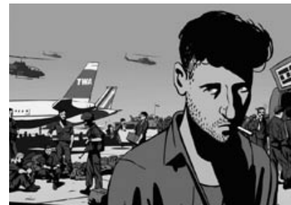
→ Waltz with Bashir

Der Film wird vom 6. 11. – 26. 11. täglich um 20 Uhr gezeigt.