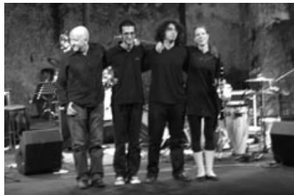
→ »Matabb« featuring Manfred Leuchter

Das deutsch-palästinensische Ensemble Matabb gründete sich im Sommer 2006 mit dem Ziel, in Palästina eine Jazzszene zu etablieren. Seither spielten Anna-Mareike Vohn, Ahmed Eid und Tareq Rantisi auf zahlreichen internationalen Jazzfestivals und touren immer wieder durch die Länder des Nahen Osten. Neben traditionellen und zeitgenössischen orientalischen Stücken spielen Matabb hauptsächlich Werke des norwegischen Komponisten Oystein Bru Frantzen. Aber auch eigene Kompositionen sind im Repertoire enthalten, in denen sich europäischer Jazz mit orientalischen Elementen zu Weltmusik verbindet. Manfred Leuchter, in der internationalen Jazzszene bekannt als Akkordeonspieler, Komponist und Produzent, begleitet das Ensemble regelmäßig als Gast.