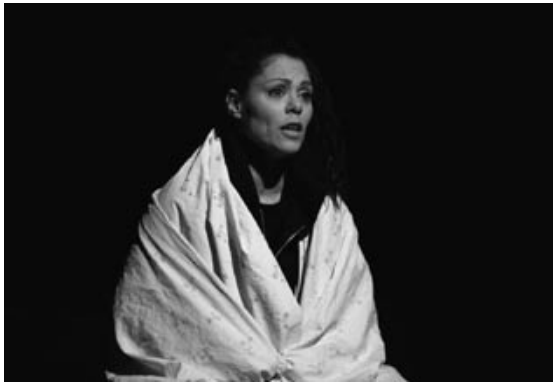
→ Denuded – Bis auf die Haut

Eine Produktion des Habimah National Theatre, Tel Aviv. Die Aufführungsrechte der deutschen Übersetzung von Angela Kingsford-Röhl liegen beim Litag Theaterverlag, Bremen.