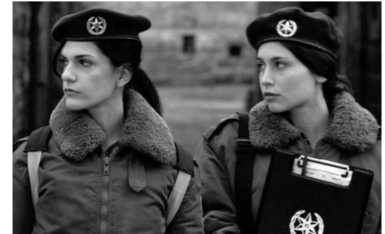
→ Close to Home

Die rebellische Smadar und die introvertierte Mirit, beide achtzehn Jahre alt, leisten gemeinsam ihren Dienst in der israelischen Armee ab. Eingesetzt sind sie in Jerusalem als Streife: Ihre Aufgabe ist es vorbeigehende Palästinenser anzuhalten, ihre Ausweispapiere zu kontrollieren und die persönlichen Daten aufzunehmen. Die beiden jungen Frauen sind jedoch vor allem mit sich selbst beschäftigt – mit ihren Schwärmereien, Trennungen von Freunden und der vielschichtigen Beziehung, die sich zwischen ihnen entwickelt. Bis sich eines Tages die politische Realität Jerusalems in ihr Leben drängt. »Close to Home« ist ein Film über das Erwachsenwerden vor dem Hintergrund des konfliktreichen Alltags in Israel und Palästina.