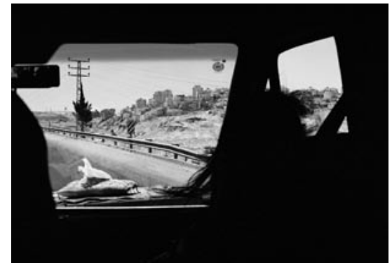
→ Fahrt durch die Westbank