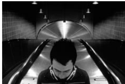
→ Elektronische Music in the Middle East

Mo 24.11. * 17 Uhr * KulturForum * Eintritt: Spende → ⑦