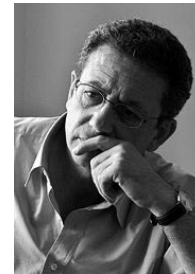
→ Mustafa Barghouthi

Fr 28.11. * 19.30 Uhr * Bach-Saal der CAU, Rudolf-Höber-Str.3 * 8,-/erm. 5,- Euro → ②