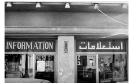
→ Touristinformation in Alexandria