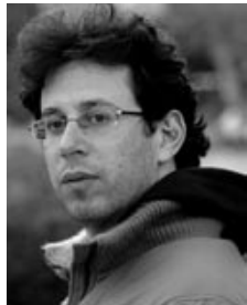
→ Assaf Gavron

2006 sorgte der israelische Bestsellerautor, Übersetzer und Musiker Assaf Gavron mit seinem Roman »Ein schönes Attentat« nicht nur in Israel für Aufsehen. Die Geschichte um drei Attentate, die in einer Parallelmontage von einem israelischen und einem palästinensischen Protagonisten erzählt wird, besticht durch eine sensible und detailgenaue Schilderung der Lebensumstände auf beiden Seiten der Mauer. Gavron lässt den Leser in eine Welt der Gewalt blicken, er zeigt anhand glaubhaft entwickelter Charaktere die Tragödie des Terrors, welcher erzeugt wird durch die Arroganz israelischer Soldaten, die die Bewohner der arabischen Gebiete schikanieren, aber auch durch den Hass der Lagerbewohner selbst. »Das Mädchenschiff« von Michal Zamir eröffnet eine andere Perspektive auf das Thema Gewalt: Der Roman thematisiert den sexuellen Missbrauch von Frauen im Mikrokosmos der israelischen Armee.