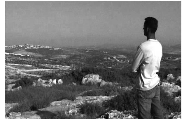
→ Fremd im eigenen Land

In Kooperation mit der Stiftung »Erinnerung, Verantwortung und Zukunft«