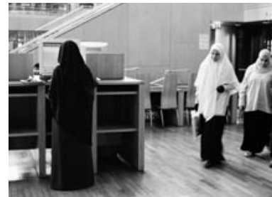
→ In der Bibliothek von Alexandria

Mo 24.11. * 19 Uhr * Landeshaus, Casino, 3. Stock * Eintritt frei → ⑤