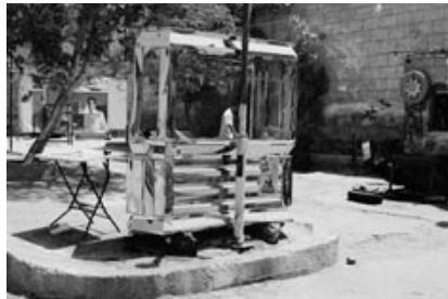
→ City of the Dead, Kairo