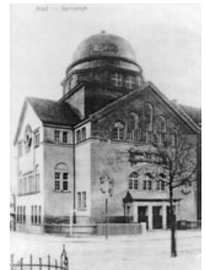
→ Kieler Synagoge vor 1938

Eine Veranstaltung der Jüdischen Gemeinde Kiel und der Gesellschaft für Christlich-Jüdische Zusammenarbeit