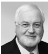
Peter Harry Carstensen → Ministerpräsident des Landes Schleswig-Holstein