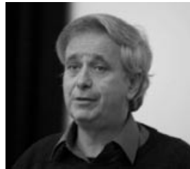
→ Ilan Pappé

Eine Veranstaltung der Heinrich-Böll-Stiftung Schleswig-Holstein mit dem Flüchtlingsrat Schleswig-Holstein und der Deutsch-Palästinensischen Gesellschaft