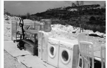
→ Verkaufsstand in Ramallah

→ Achtung: Extratermine für Schulklassen. Infos unter Telefon 0431 / 901 34 08