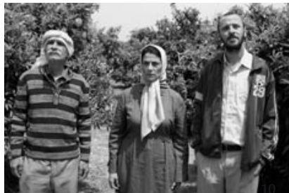
→ Lemon Tree

Der Film wird von Do 30. 10. bis Mi 19. 11. gezeigt, die genauen Termine finden Sie unter www.diepumpe.de.