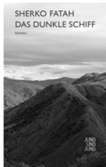
→ Sherko Fatah

Vorverkauf: Literaturhaus Schleswig-Holstein, Schwanenweg 13, Telefon 0431 / 579 68 40