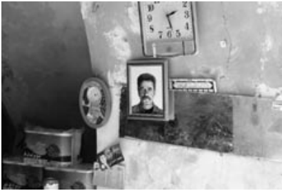
→ Ausstellung in Hebron